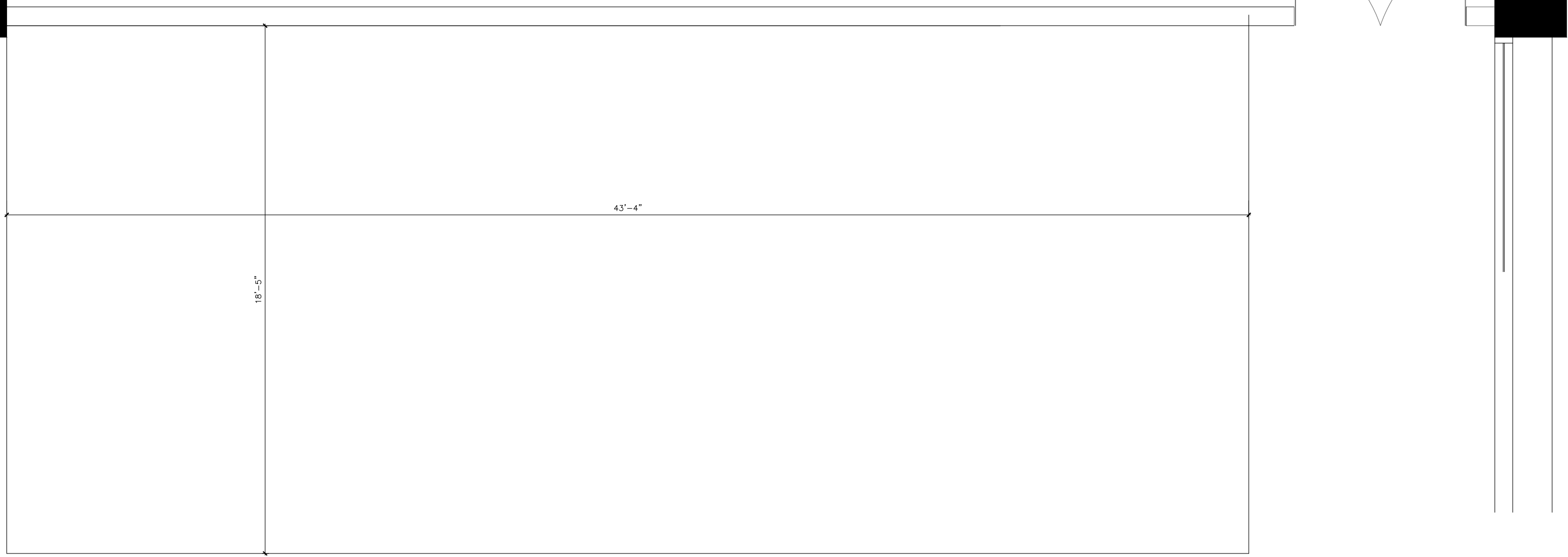
ELEVACION "D" ESCALA: 1/2" = 1'-0"